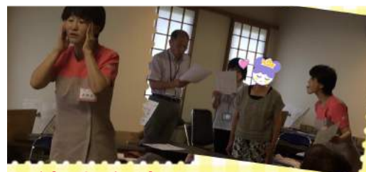
ハイ！よろこんで！ 口腔体操の実演もさせて頂きました♪

私たちは、今日一日、”ハイよろこんで！” の精神で品格溢れる「てのひらチーム」づくりに 全力を注ぎます。。